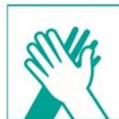
3- Frotá las palmas entre sí