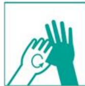
5- Frotá de a uno, dedos y pulgares