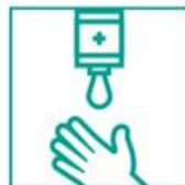
2- Aplicá jabón