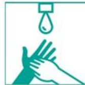
7- Enjuagá con agua