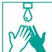
1- Mojó tus manos con agua