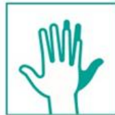
6- Frotá el dorso de tus manos