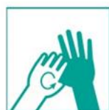
5- Frotá de a uno, dedos y pulgares