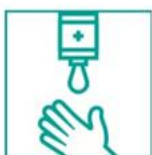
2- Aplicá jabón