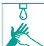
7- Enjuagá con agua