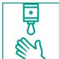
2- Aplicá jabón