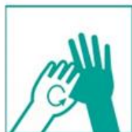
5- Frotá de a uno, dedos y pulgares