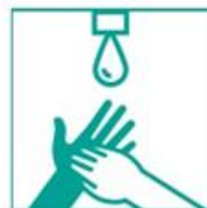
7- Enjuagá con agua