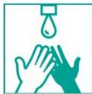
1- Mojá tus manos con agua