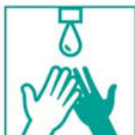
1- Mojá tus manos con agua