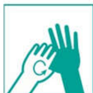
5- Frotá de a uno, dedos y pulgares