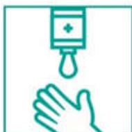
2- Aplicá jabón