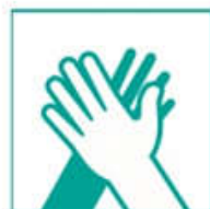
3- Frotá las palmas entre sí