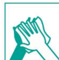
8- Secá con una toalla de papel