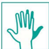
6- Frotá el dorso de tus manos