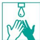
1- Moja tus manos con agua